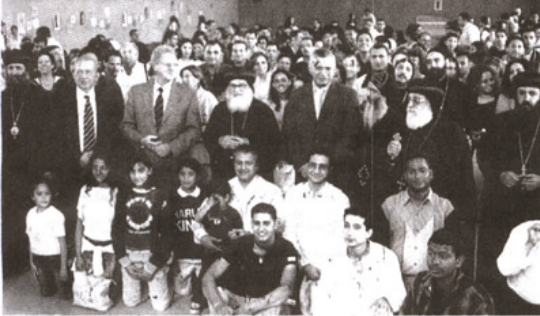
نيافة الأنبا موسى مع بعض الآباء الأساقفة وبين سفير مصر وعمدة البلدة