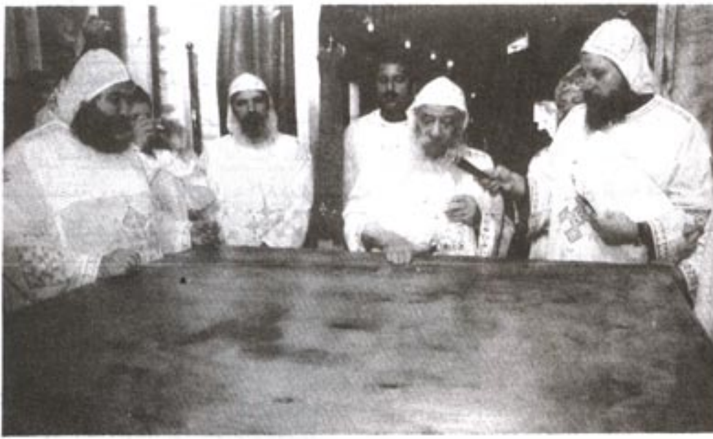
تدشين مذبح دير السيدة العذراء والقديس موسى الأسود بـ Corpus Christi